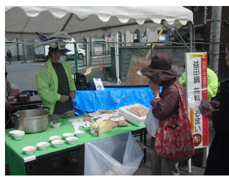
【益田鍋振る舞い】 11時～