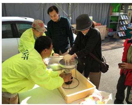
【お米のすくいどり】 ①10時～②12時～

日時: 11月11日(土)・12日(日)10時～15時 場所: 高槻市姉妹都市交流センター