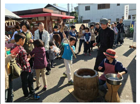
【餅つき振る舞い】 ①11時～②13時～