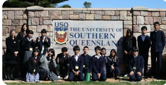
現地大学で語学研修！