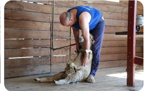
牧場体験等のプログラム！

高槻市の姉妹都市であるオーストラリア・トゥーンバ市は優れた教育環境を誇る、美しい庭園の街です。 この夏、異文化体験をしてあなたの世界を広げてみませんか！